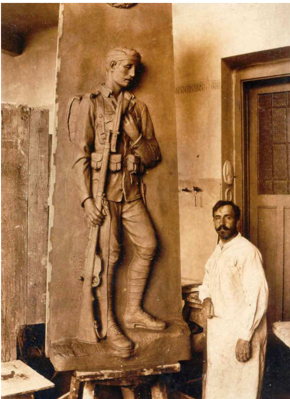
A szobor gipszből készült változata a művésszel. A gipszszobor alapján készült el a végső, műkő változat