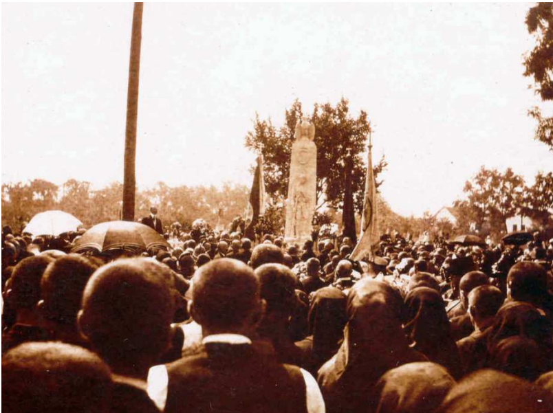
A Hősök szobra felavatása 1920. augusztus 20-án

„Művészettörténeti jelentősége abban áll, hogy az emberfölötti gigászi barokk korszakot emberméretűvé tette, nyugalmas utakra vezette. Egyben megfékezte a mindent elárasztó [festett] gipszszobor-özönt. Egyháztörténeti jelentősége sokkal nagyobb! Egyedül vállalta a mi ifjú korunkban fölfelé ívelő fejlődő, terjeszkedő korszak sürgető megrendeléseit. Nyújtotta, amit vártak tőle, a derűs, szent szobrok százait. Tevékenyen hozzájárult ahhoz, hogy a mögöttünk levő évtizedeket az újkori magyar katolikus egyház gazdag és diadalmas korszakának láthassuk.” (Részlet Erdőssy Béla festőművész beszédéből, amely 1984. augusztus 26-án, a művész születésének 100. évfordulóján tartott emlékmisén hangzott el.)