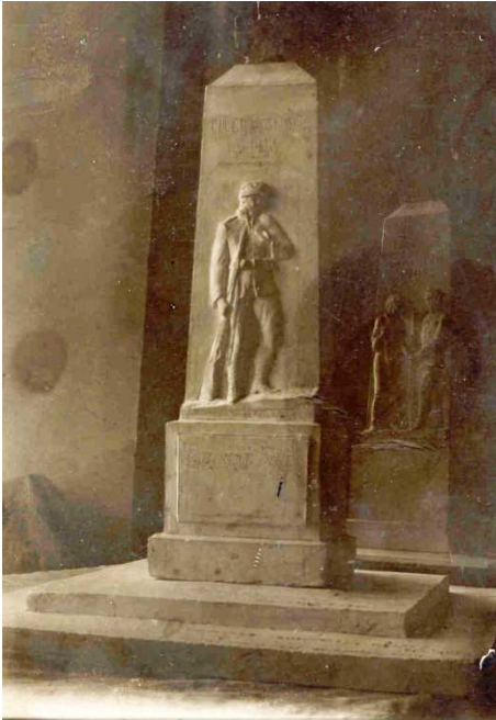
A szobor agyag makettja a művész műtermében

Krasznai Lajosnak főiskolai állást ajánlottak, de Krasznai kiállt a Katolikus Egyház mellett, ezért műtermét, házat államosították. A korosodó művész ezután is dolgozott, haláláig (1965. november 20.) további kisebb megrendeléseknek tett eleget vidéki templomoknak, illetve háborús károk restaurálásában is szerepet vállalt. Szobrai, oltárai és szobrászmunkái az országban számos településen láthatóak ma is. Alkotásainak egy része a kommunista időkben elpusztult, a művész neve pedig feledésbe merült.